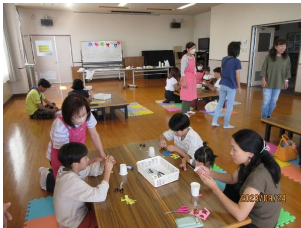
家族ごとに一つのテーブルで作業