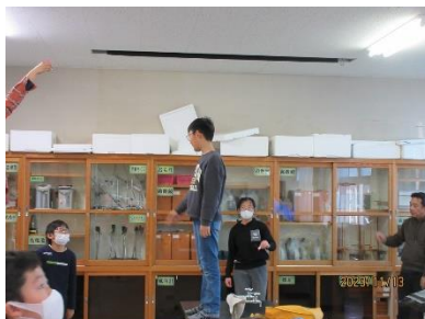
高い所から飛翔 スタート