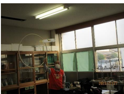
的にしたフラフープ環を 潜り抜けた瞬間