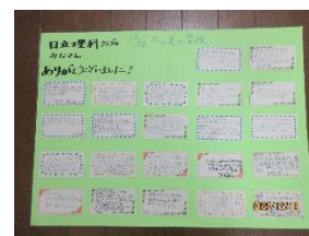
お礼のメッセージ