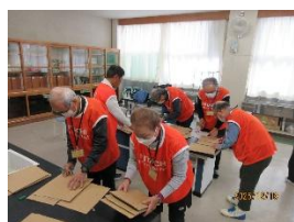
発車板準備はクラブ員で 対応（お手数かけました）