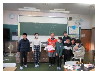
お礼のメッセージを戴いた