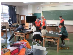
児童6名全員勢ぞろい

いろいろな声があった。これらの体験が理科好きのトリガーになってくれればうれしい。