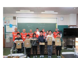
全員頑張りました