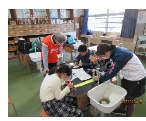
金原先生にもアドバイス？