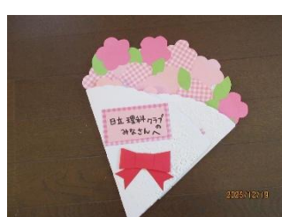
クレープを上げると???